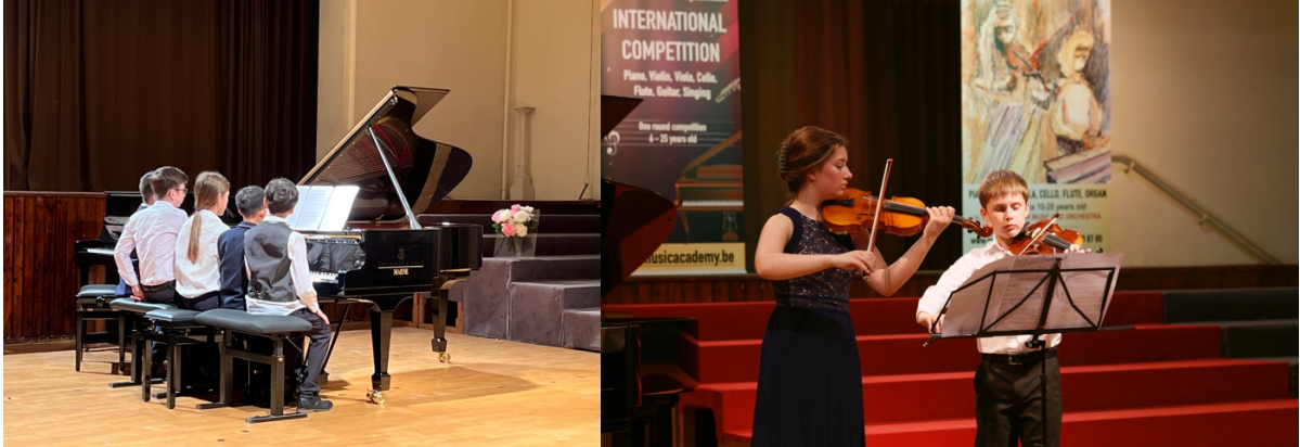
Music Academy FORTE